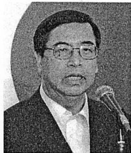
駐日ベトナム大使館の ピン特命全権大使